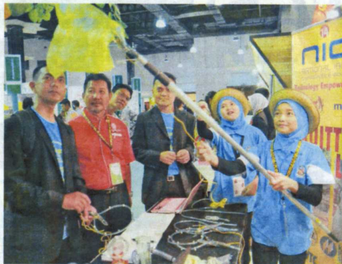
PEMENANG Anugerah Inovasi (AIN) kategori sekolah, SK Tarcisian Convent, Ipoh yang telah mencipta alat membalut buah dengan kaedah yang cepat dan murah.

Malah, menerusi pengenalan inovasi baharu, mampu menjadikan Malaysia sebagai sebuah negara pembekal teknologi menjelang 2020.