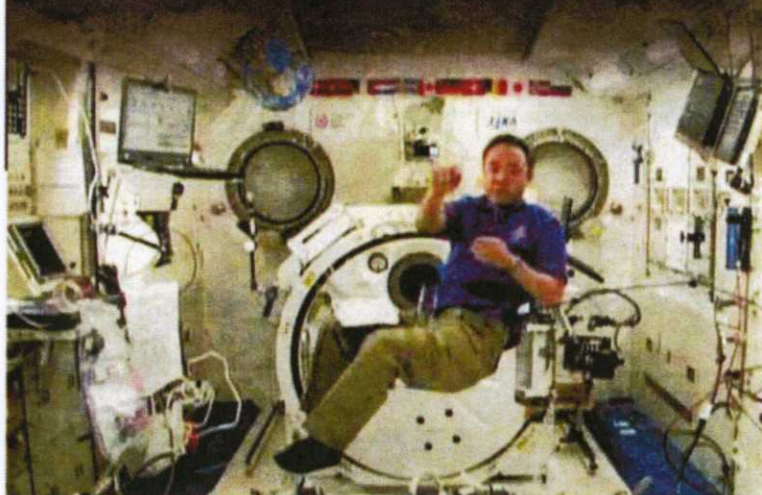
SEORANG angkasawan Jepun menjalankan penyelidikan di ISS pada program Try Zero G 2.

Borang penyertaan dan cadangan - cadangan perlulah dikembalikan kepada Angkasa melalui pos atau emel atau mengisi borang penyertaan on-line di www.angkasa.gov.my/