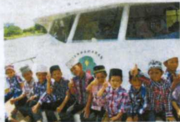
The kids were thrilled to go on the Putrajaya Lake Cruise.

After that, it was off to Putra Mosque, where they were mesmerised by the beauty of the famed mosque.