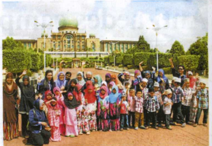
Mavcap staff and the children of Pusat Jagaan Rumah Kesayangan started off their exciting trip to Putrajaya at Perdana Putra.

At the lake, the kids were surprised with an