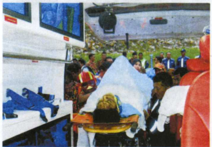
REMS amat membantu menyelamatkan pesakit yang menghadapi penyakit kronik.

"Bagi menggunakan REMS, setiap pesakit akan didaftarkan dan segala maklumat asas berkenaan kesihatan mereka akan direkod dan disimpan. "Tambahan, ambulans juga akan dilengkapi bersama AVLS (Automatic