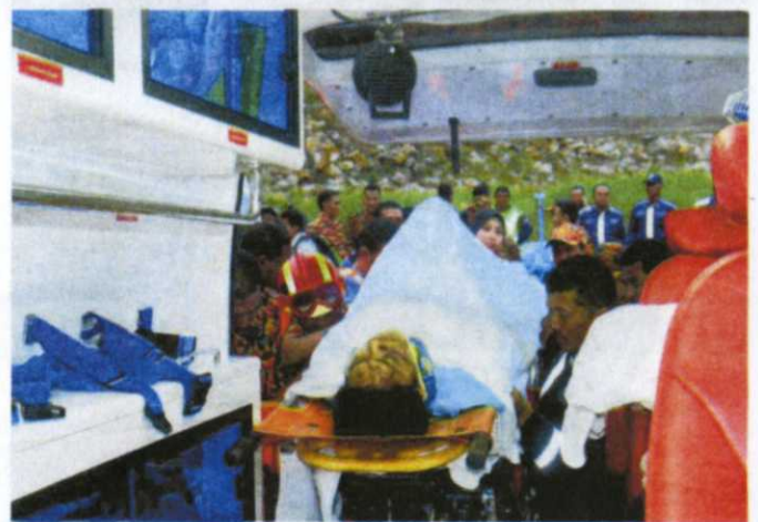
REMS amat membantu menyelamatkan pesakit yang menghadapi penyakit kronik.

"Bagi menggunakan REMS, setiap pesakit akan didaftarkan dan segala maklumat asas berkenaan kesihatan mereka akan direkod dan disimpan. "Tambahan, ambulans juga akan dilengkapi bersama AVLS (Automatic