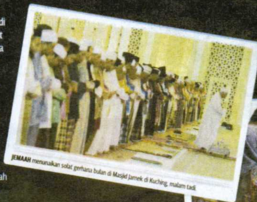
JEMAAH menandakan solat gerhana bulan di Masjid Jamek di Kuching, malam tadi.

"Semua umat Islam wajar mengambil hikmah terhadap fenomena berkenaan dan ia adalah berdasarkan kepada hadis yang diriwayatkan oleh Imam Muslim bahawa bulan dan matahari adalah dua tanda kebesaran Allah,"katanya