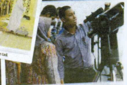
PEGAWAI Pejabat Mufti Wilayah Persekutuan menceraap gerhana bulan merah di Me Kuala Lumpur dalam keadaan cuaca bersejerebu.