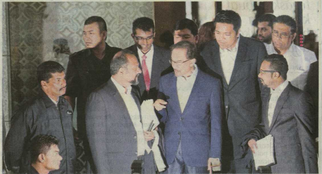
Anwar (tengah) bersama peguam selepas kes rayuannya ditangguhkan di Istana Kehakiman, Putrajaya, semalam.