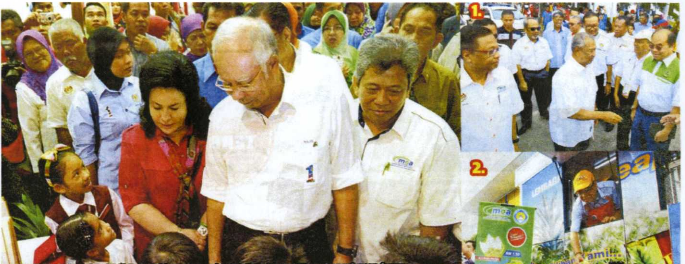
PERDANA Menteri, Datuk Seri Najib Tun Razak bersama-sama isteri, Datin Seri Rosmah Mansor beramah mesra dengan kanak-kanak selepas menyempurnakan Majlis Perasmian MAHA & HPPNK 2014 di MAEPS, Serdang.