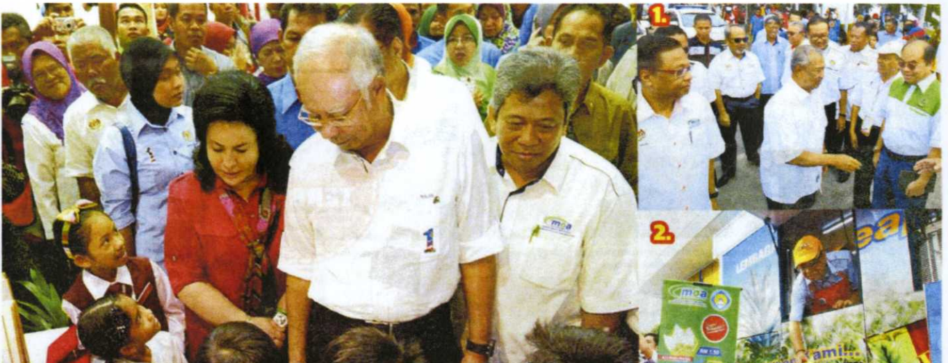
PERDANA Menteri, Datuk Seri Najib Tun Razak bersama-sama isteri, Datin Seri Rosmah Mansor beramah mesra dengan kanak-kanak selepas menyempurnakan Majlis Perasmian MAHA & HPPNK 2014 di MAEPS, Serdang.