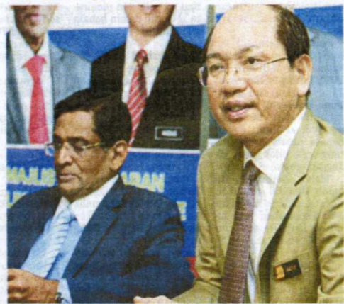
Madius ketika sidang media pada majlis pelancaran Aplikasi Mobile iDengue di Kuala Lumpur, semalam. Yang turut hadir S Subramaniam.