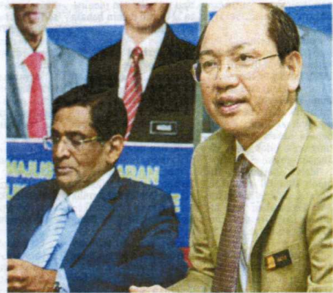
Madius ketika sidang media pada majlis pelancaran Aplikasi Mobile iDengue di Kuala Lumpur, semalam. Yang turut hadir S Subramaniam.