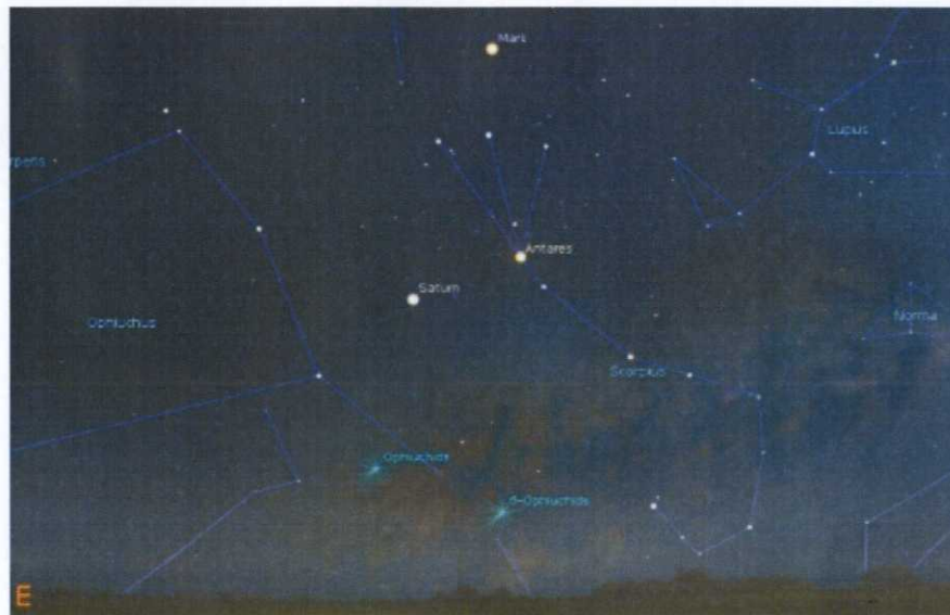
Kedudukan planet Zuhal (Saturn), Marikh dan buruj Scorpio pada langit Timur sekitar jam 8.00 malam pada Jumaat, 3 Jun ini.

KUALA LUMPUR 1 Jun - Orang ramai di negara ini berpeluang untuk melihat planet Zuhal pada posisi istiqbal (bertentangan dengan matahari) melalui teleskop, binokular malahan dengan mata kasar di langit Malaysia selepas matahari terbenam, pada Jumaat ini.