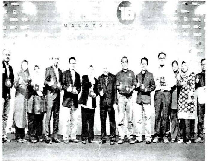
Penyelidik UniSZA mencatat pencapaian membanggakan pada ITEX 2016.