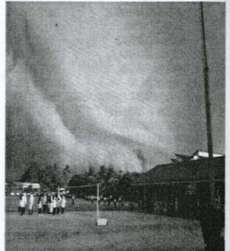
BEBERAPA murid sekolah melihat pemandangan awan hitam akibat fenomena garis badai di Pasir Salak semalam.

"Lazimnya keadaan awan itu boleh statik sehingga beberapa jam bergantung kepada faktor angin. Ia adalah situasi biasa dan tiada apa yang perlu dibimbangkan," katanya.