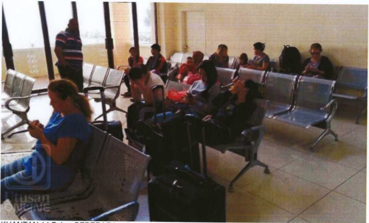
KUANTAN 14 Feb. - BEBERAPA pelancong yang terkandas akibat laut bergelora di Pulau Tioman, Rompin, di sini hari ini.

KUANTAN 14 Feb. - Keadaan laut bergelora dan angin kencang ekoran cuaca buruk sejak semalam menyebabkan kira-kira 500 pelancong terkandas di Pulau Tioman, Rompin dekat sini.