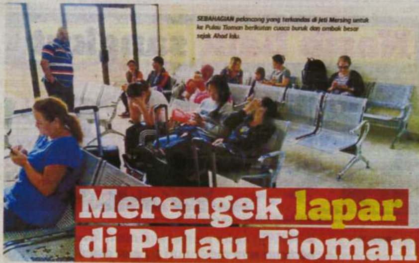
SEBAGIAN pelancong yang terkandas di Jeti Mersing untuk ke Pulau Tioman berikutan cuaca buruk dan ombak besar sejak Ahad lalu.