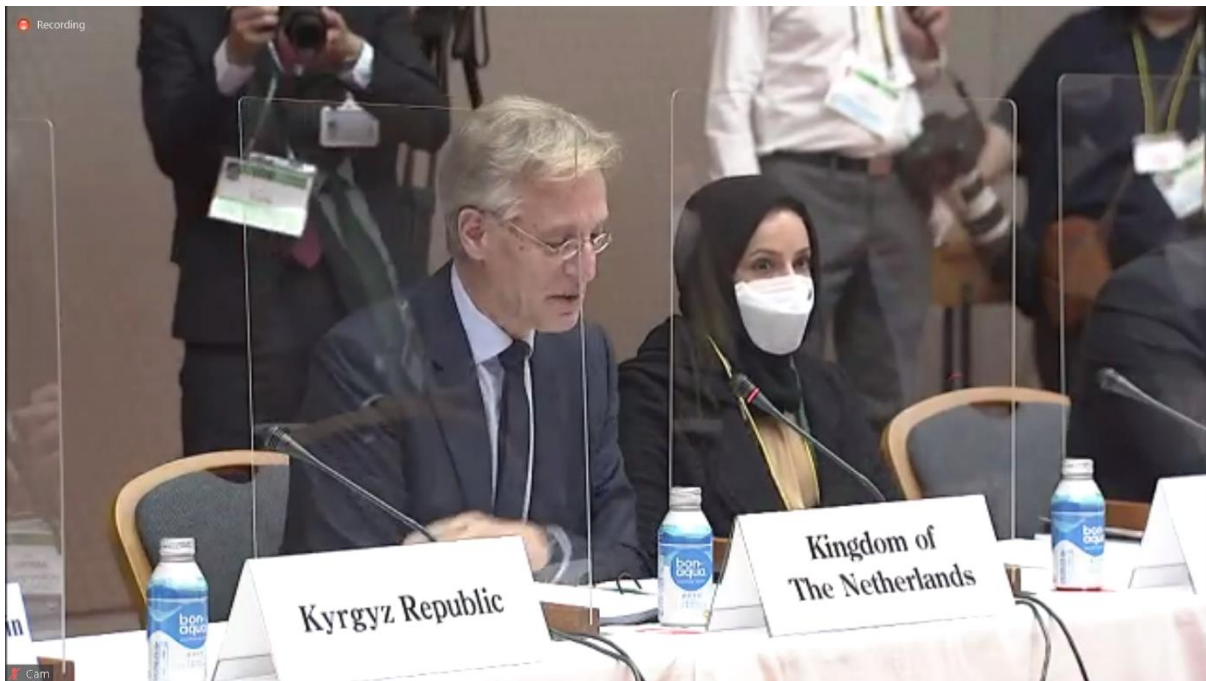
Antara Menteri-Menteri lain yang mengambil bahagian