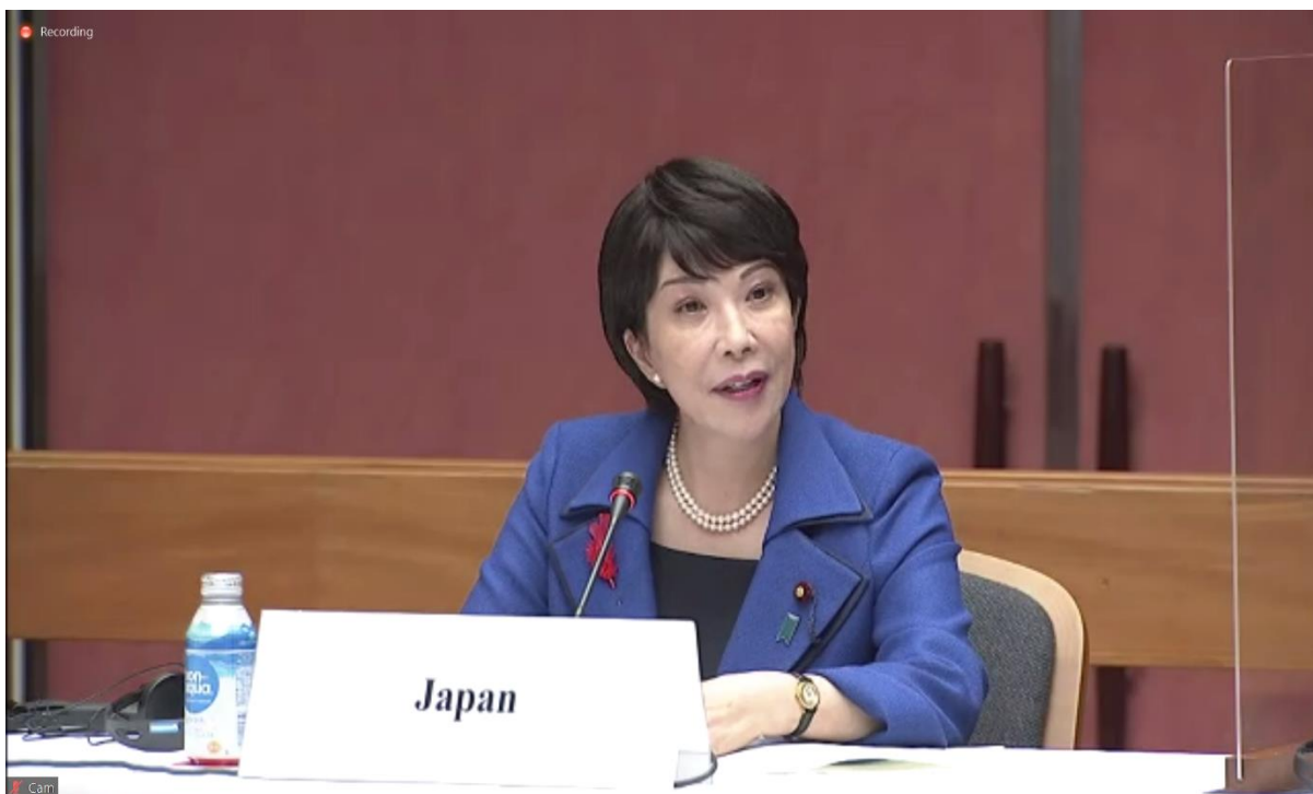
Pengerusi Sesi Meja Bulat Menteri-Menteri Yang Ke-19, TYT. Takaichi Sanae, Menteri Dasar, Sains dan Teknologi Negara Jepun.